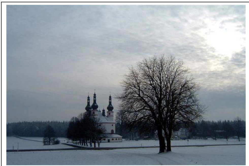
Foto der Kappl vom 17.12.2010

So waren sich die Groppenheimer und mit ihnen das gläubige Volk des Stiftlandes und darüber hinaus der Kappl und ihrer Ausstrahlungskraft allzeit bewusst, was auch so bleiben möge!